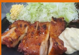
タルタルチキン定食