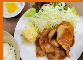
しょうが焼定食 800円